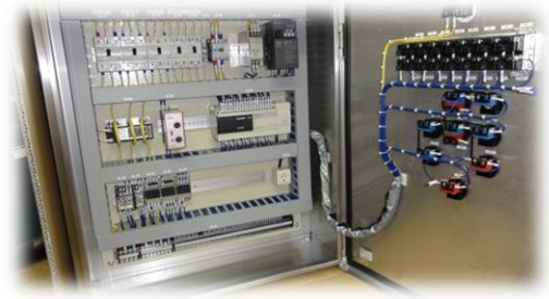
安全検証制御盤実習装置

安全検証制御盤実習装置、保護導通試験器、絶縁抵抗計、絶縁耐圧試験器、メモリハイレコーダ、クランプメータ、騒音計、放射温度計、サーモグラフィ、漏れ電流試験